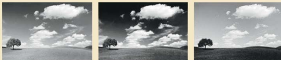
Couleurs RVB : trois couches rouge vert bleu

Le RVB (rouge vert bleu) correspond au RGB anglais (red green blue). Créé en 1931 par la commission internationale de l'éclairage, ce standard regroupe les trois couleurs primaires monochromatiques soit : le rouge, le vert et bleu. Le code couleur de ce standard s'exprime ainsi : R : 0 V : 0 B : 0 (le 0 correspondant au noir) cette couleur donnera un noir. Remarque : la valeur du RVB peut soit s'écrire en pourcentage de 0 à 100% soit en numéraire de 0 à 255.