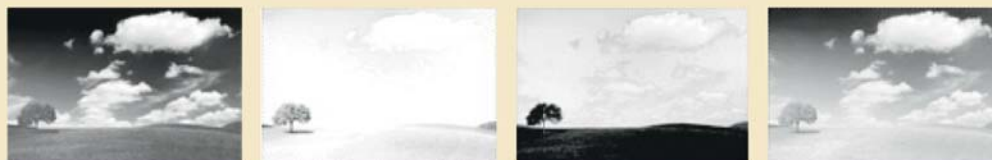
CMJN : quatre couches

Le CMJN appelé plus techniquement quadrichromie est un standard colorimétrique pour l'imprimerie permettant de reproduire un large spectre de couleurs. Ces couleurs sont créées en mélangeant trois encres de bases : le cyan, le magenta et le jaune auxquels on ajoute le noir.